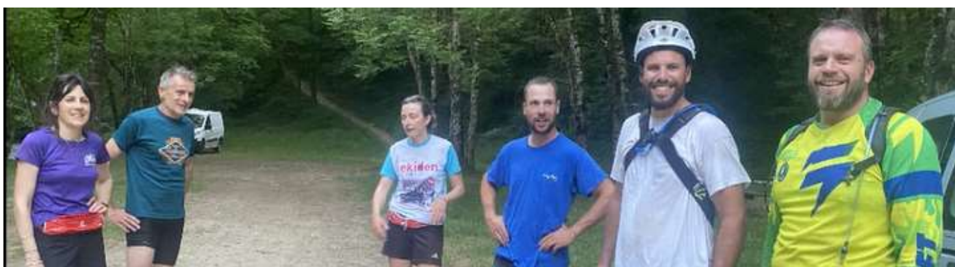
L'association en action

Le 7 Aout 2022, « nous vous espérons nombreux » dirait sa majesté le Roi de VERSAILLES /VIAUR!!