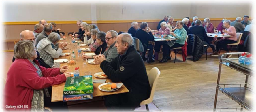
Galette des Rois 12/01/2024