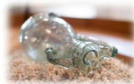
Amphore au serpent sur' fritte ' de quartzite.Jep 2024