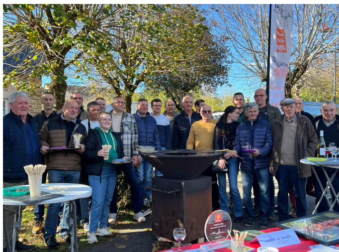
Les chasseurs de Camboulazet

Recevez nos meilleurs vœux de bonheur pour cette nouvelle année