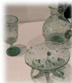
réalisations jep2024 Noyès Pierrot Dorémus