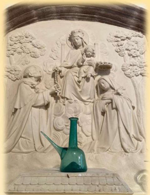
Pièce d'Alain GUILLOT