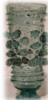
décor Czech jep 2024 P.Dorémus