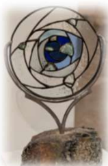
L'oeil composition vitrail tiffany, en verres d'époques multiples sur brique du four de Noyès