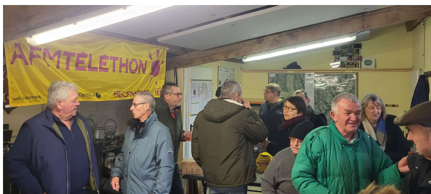
Vente de la daube au profit du Téléthon

Lors de cette vente de barquettes une participation est reversée au Téléthon, merci à tous pour votre participation.