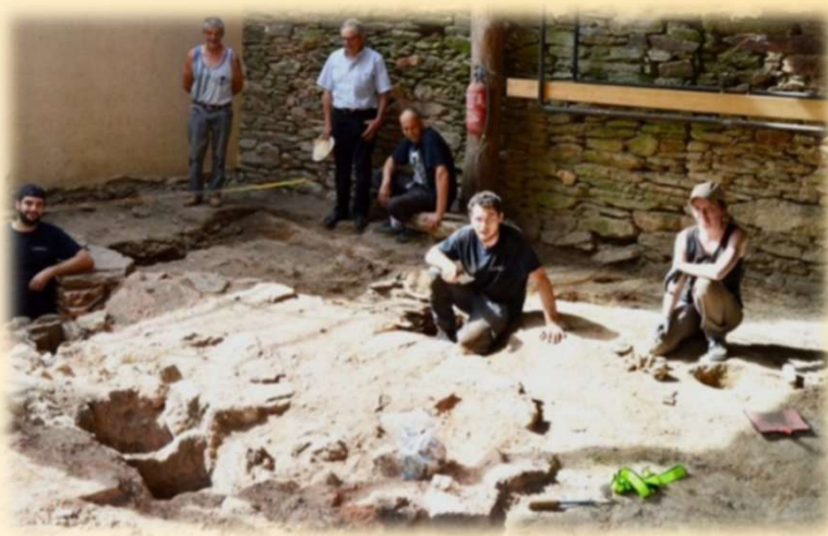
Fouilles du four verrier