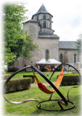
Suspension Courbe des ombres,(modèle déposé) A.td, jardin public Camboulazet